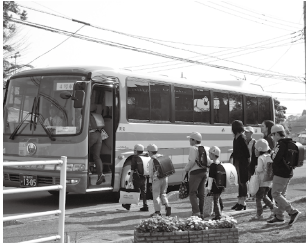
スクールバス バス停