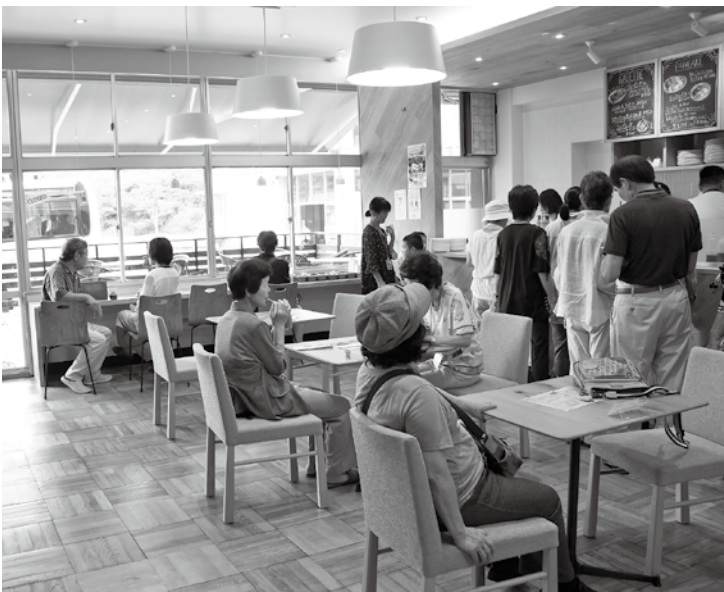
新たな活用が始まった旧西小

重複する公の施設を避けて、一つの複合施設にしていく方向に向けてしっかり取り組んでいきたいと思っております。