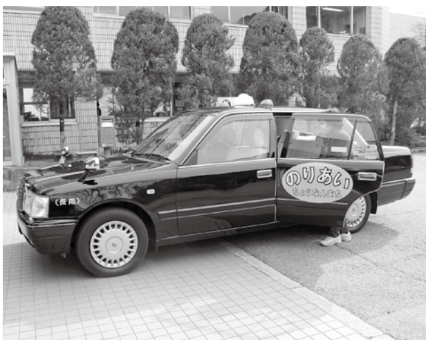
利用が増えている乗り合いタクシー

P D C A サイクルに基づく検証や巡回バスの利用者へのヒアリングを行い、地域公共交通活性化協議会に諮って、現行ルート、ダイヤが使いやすい最適であるのかを判断していきたいと考えています。