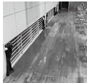
旧豊栄小学校体育館 雨漏り箇所

していく考えです。周辺の安全性も考慮して避難所を設置し、施設については定期的に安全性を確認し開設できるように努めてまいります。