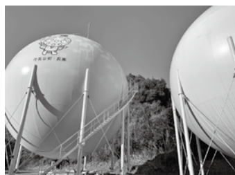
長南町のガスホルダー

真面目な公営企業で収支均衡の為に職員も減らして、23年間値上げはせず、県下でも3番目の安さです。ガスの安定供給の為、3年後、4年後に迫ったガスホルダー開放検査の積立金確保には止むを得ない負担だと考え、賛成します。