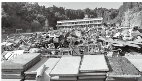
災害廃棄物が搬入された旧豊栄小学校