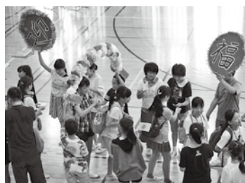
来町した台湾の福林国民小学校

教育委員会と協議しながら、継続的な相互交流に財政支援を含めて、できる限り支援をしていきたいと思っています。