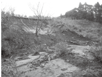
野見金公園の崩落土