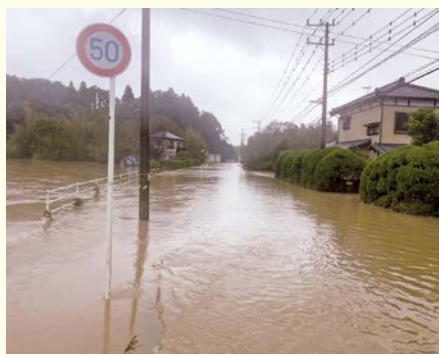
10月25日の豪雨後の千手堂地先

昨年は、全国的に台風が発生し、本町でも豪雨・強風による災害により、多くの被害が発生しました。本町も今までにない被害となりました。基幹産業の農業では、カメムシ被害、さらに施設の倒壊により収益が減少し修繕費が増加した年でありました。今後も、議会としても防災に努めてまいります。災害のない良い年でありたいと思います。 (御園生 明)