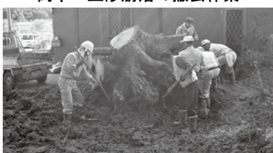
近所や地域の人で片づけました(蔵持)