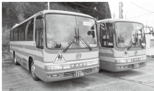
▶通学に使用しているスクールバス

中学生の雨天時のスクールバス利用について 保護者の方からは、雨天時の自転車での通学について、車の交通量も多くなっていることから、交通事故などを大変危惧しております。