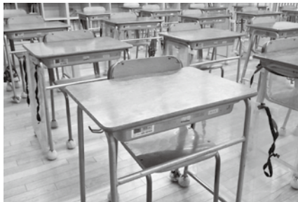
▶現在の小学校の机

また、児童・生徒及び教職員から机を大きくしてほしいとの要望はありませんでした。特に小学校では、掃除の時の机の移動が大変になるなどの不都合の点が出てしまいます。