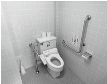
▶農村環境改善センターの洋式トイレ